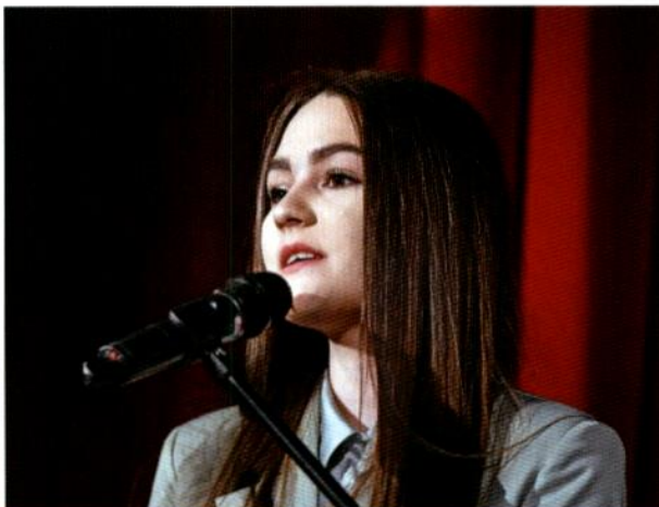
Выступление участницы конкурса