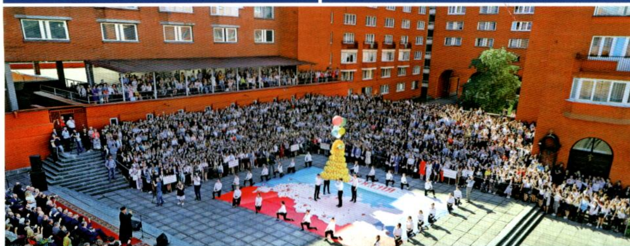
Площадь академика Лихачева, День знаний в Санкт-Петербургском Гуманитарном университете профсоюзов