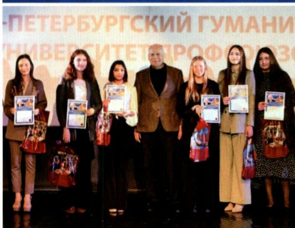
Старшекласники — участники форума и профессор СПбГУП народный артист России Н. В. Буров